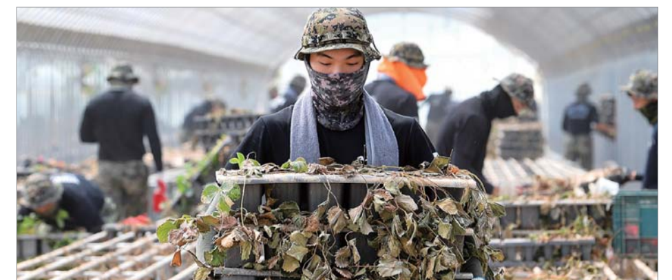
망가진 비닐하우스 육군특수전사령부 예하 천마부대 전갈대대 장병들이 지난 21일 전라남도 곡성군 고달면 일대 딸기 재배 비닐하우스에서 침수로 망가진 딸기포트를 옮기고 있다.