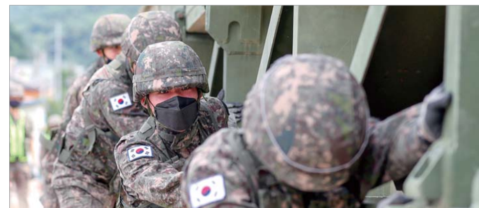
무너진 다리 대신할 ‘간편조립교’ 지난 12일 강원도 인제군 서화면 천도리에서 육군3군단 공병여단 장병들이 집중호우로 다리가 내려앉아 고립된 지역 주민들을 위해 군 작전용 교량인 ‘간편조립교(MGB-Medium Girder Bridge)’를 설치하고 있다.