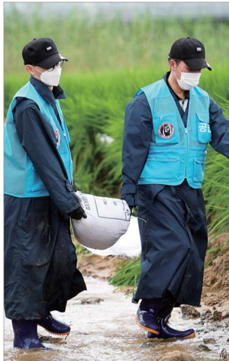
논둑 보강 중부지방에 내린 집중호우로 큰 피해가 발생한 가운데 지난 4일 충청북도 충주시 엄정면의 한 수해농가를 찾은 공군19전투비행단 장병들이 급격히 불어난 물로 붕괴된 논둑을 보강 하고 있다.